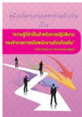
หนังสือ ความรู้ที่จำเป็นสำหรับการปฏิบัติงาน ของข้าราชการหรือพนักงานส่วนท้องถิ่น (Technical Knowledge)