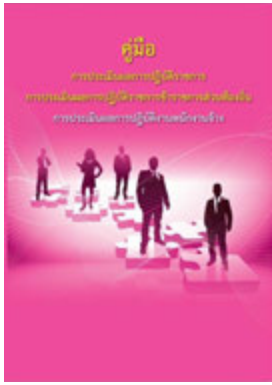
หนังสือ การประเมินผลการปฏิบัติงานพนักงานจ้าง