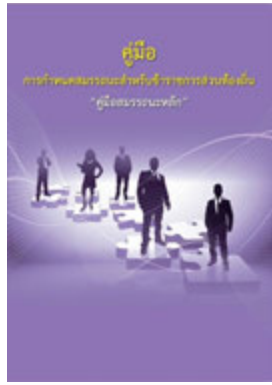
หนังสือ สมรรถะหลัก