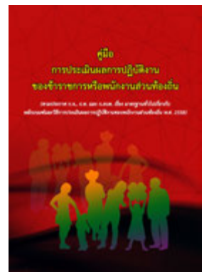
หนังสือ การประเมินผลการปฏิบัติงาน ของข้าราชการหรือพนักงานส่วนท้องถิ่น