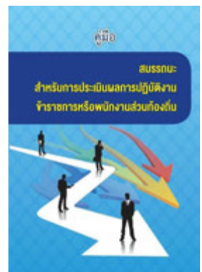
หนังสือ สมรรถนะสำหรับการประเมินผลการปฏิบัติงาน ข้าราชการหรือพนักงานส่วนท้องถิ่น