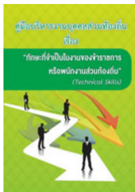
หนังสือ ทักษะที่จำเป็นในงานของข้าราชการ หรือพนักงานส่วนท้องถิ่น (Technical Skills)