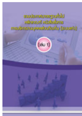
หนังสือ รวมประกาศมาตรฐานทั่วไป หลักเกณฑ์ หนังสือสั่งการ การบริหารงานบุคคลส่วนท้องถิ่น