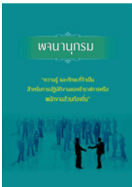
หนังสือ ความรู้ และทักษะที่จำเป็น สำหรับการปฏิบัติ งานของข้าราชการหรือพนักงานส่วนท้องถิ่น