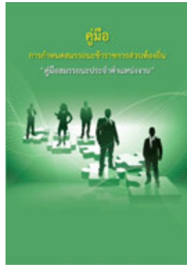
หนังสือ สมรรถะประจำตำแหน่งงาน