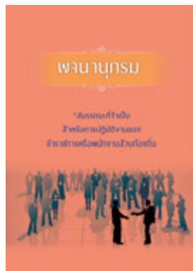
หนังสือ สมรรถนะที่จำเป็นสำหรับการปฏิบัติงานของ ข้าราชการหรือพนักงานส่วนท้องถิ่น